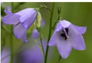
Die rundblättrige Glockenblume

Genauere Informationen, welche Wildbiene welche Pflanze zum Pollensammeln besucht, sind in dem folgenden Buch von Paul Westrich enthalten: Die Wildbienen Deutschlands, Ulmer Verlag 2018.